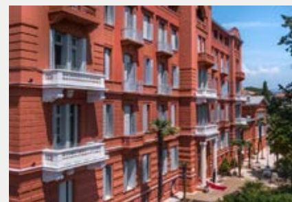
Hotel Heritage Imperial

In Opatija hebben wij **** Hotel Heritage Imperial Opatija voor u gereserveerd. Dit is een charmant viersterrenhotel, gelegen in het hart van de elegante kustplaats Opatija, op korte afstand van de iconische Lungomare-promenade en het centrum van de stad. Het hotel biedt een ideale mix van historische grandeur en moderne voorzieningen. De kamers zijn stijlvol ingericht en voorzien van douche of bad, toilet en televisie. Het hotel heeft verder een prachtig restaurant en een wellness & spa centrum.