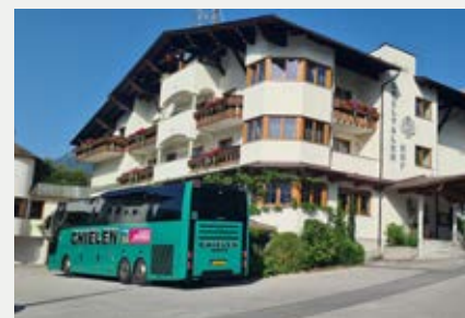
Panoramahotel Gurgtaler Hof

Wij hebben kamers gereserveerd in het bijzonder gastvrije *** Panoramahotel Gurgtaler Hof van de familie Happacher. Alle comfortabele kamers zijn voorzien van wc, douche of bad, balkon of terras, telefoon, televisie. Het hotel heeft een lobby, lift, gezellige bar, een sfeer vol restaurant, een mooie tuin met terras, een buitenbad en een sauna met infraroodcabine